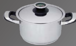
Fleischtopf mit Deckel Ø 18 cm, ca. 2,6 Ltr.