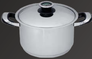
Fleischtopf mit Deckel Ø 24 cm, ca. 6 Ltr.