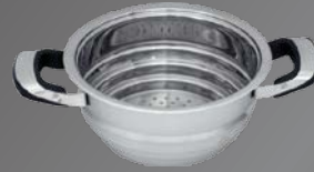
Dünstaufsatz für Ø 16/18/20 cm