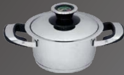
Bratentopf mit Deckel Ø 16 cm, ca. 1,5 Ltr.