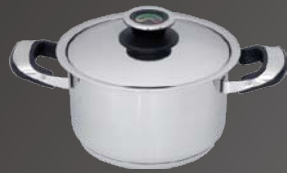
Fleischtopf mit Deckel Ø 20 cm, ca. 3,2 Ltr.