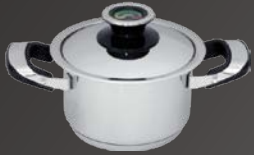
Fleischtopf mit Deckel Ø 16 cm, ca. 1,8 Ltr.